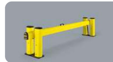
DOCK GATE XL 2500-3000