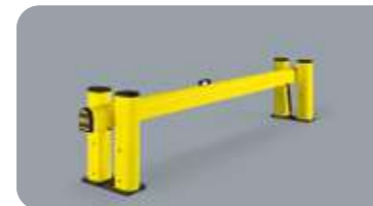
DOCK GATE L 2400-2500